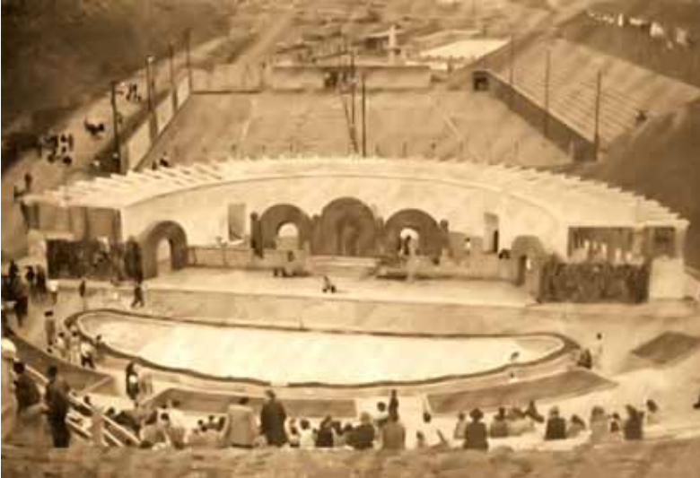
El Teatro al aire libre, las canchas de tenis y detrás la piscina. / The outdoor theater, the tennis courts and the pool on the back.