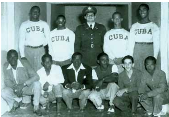
El equipo que dominó el boxeo de los VI Juegos. / The team which dominated the Boxing in the VI Games.