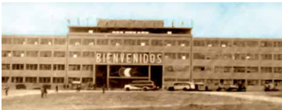
El hospital Roosevelt, acabado de construir, fue utilizado como Villa para alojar a los competidores varones. / "Roosevelt" Hospital, just built, was used as venue to accommodate Men's competitors.

On February 8, 1950 the desire of the Guatemalans to celebrate the Central American and Caribbean Games was completed.