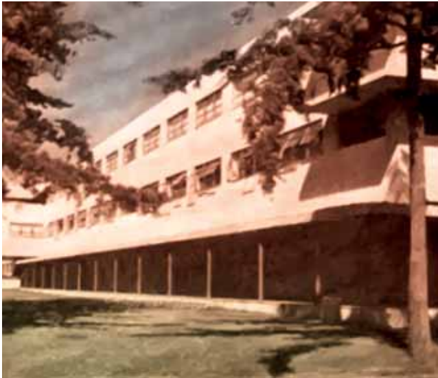
En la Escuela Nacional de Enfermeras se alojaron los delegados. / Delegates stayed at the National Nursing School.

Le siguieron Puerto Rico y Jamaica, en tanto el anfitrión Guatemala, que presentó a 309 competidores, solo obtuvo nueve metales dorados y finalizó en el quinto puesto, aunque su total de 59 premios fue el tercero mejor, detrás de mexicanos y cubanos.