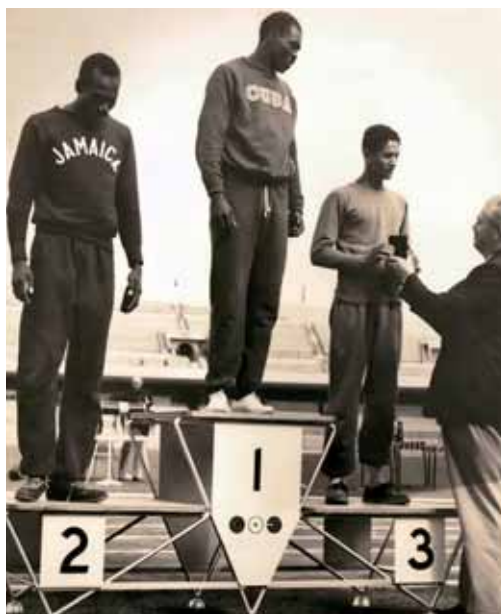
Ángel García (CUB) batió en los 400 metros a George Rhoden (JAM) y Ovidio de Jesús (PUR). / Ángel García (CUB) beat George Rhoden (JAM) and Ovidio de Jesús (PUR) at 400m.

On the subject of absences, one of the most regretful ones was that of the Cuban baseball, for lack of funds, which resulted in a poor tournament for that sport with only four participating teams. The closing was held on March 20.