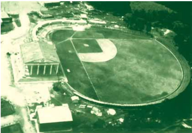
Escenario donde se jugó el torneo de béisbol. / Stadium where the baseball tournament was played.